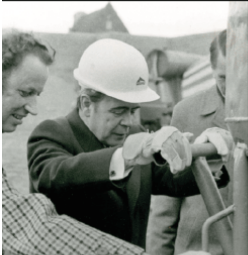
Herstel Sint Martinuskerk 1959