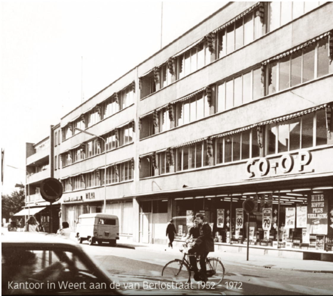
Kantoor in Weert aan de van Berlostraat 1952 – 1972